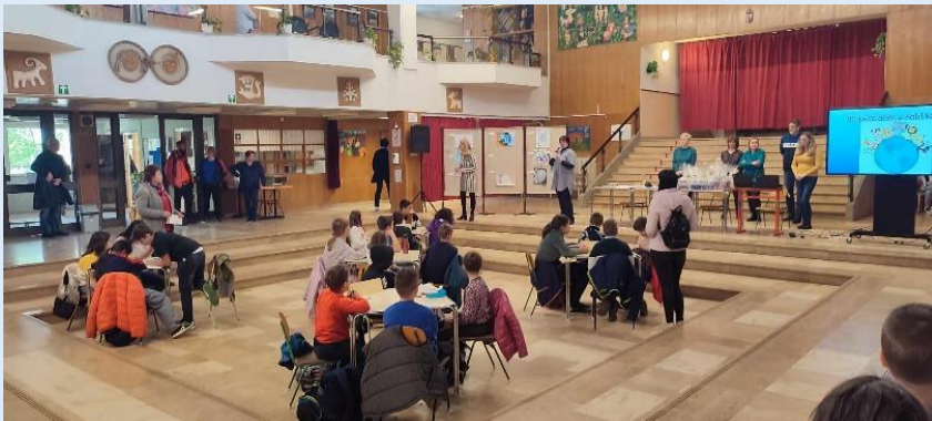
Börcsökné Csontos Tünde munkaközösség-vezető